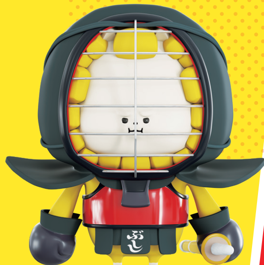
剣道普及キャラクター 「ぶしし」

剣道界最大のイベントである国際剣道連盟主催の「世界剣道選手権大会 (WKC)」。令和 9 年 (2027) に日本で開催される「第 20 回世界剣道選手権大会 (20WKC)」を契機に、全日本剣道連盟 (全剣連) の WKC に関する活動を支援し、国内外への剣道振興に繋げる「剣道世界大会応援クラブ」を創設します。剣道愛好者のみなさまから賜りましたご支援を原資として、 全剣連の WKC 活動及び積極的な国内外での普及活動に活用させていただく制度です。 みなさまのご賛同よろしくお願いいたします。