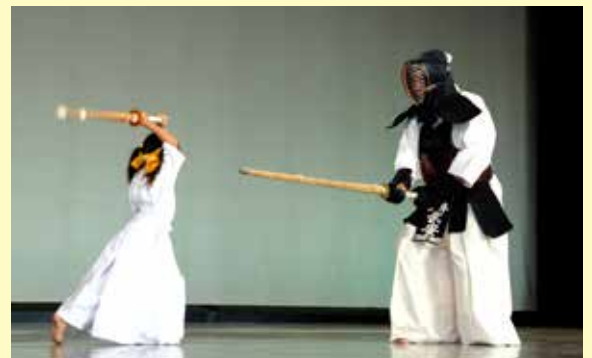
平成17年8月、愛知万博（愛・地球博）「EXPO剣道フェスティバル」で幼稚園児とのかかり稽古を披露（当時84歳）